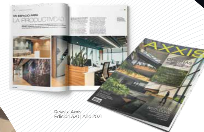
Revista Axxis Edición 320 | Año 2021